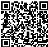
QRcode para verificação de autenticidade